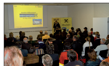
Voll besetzter Saal am Abend der Photovoltaikveranstaltung.