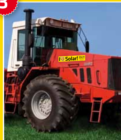
Beklebung Fahrzeug 30 x 150 cm bzw. 15 x 75 cm