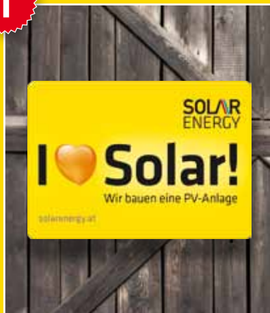
Schild 60 x 40 cm