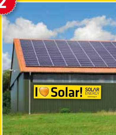
Transparent Gebäude 5 x 1 m